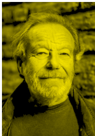
Edoardo De Angelis cantautore

Artista amato dalla critica per le sue canzoni, i suoi libri e le sue collaborazioni, è operativo da 25 anni in Friuli Venezia Giulia ed è attualmente autore e protagonista di 'Anche le statue parlano', innovativo progetto artistico di valorizzazione del patrimonio culturale ideato dall'A.C.CulturArti e destinato ai principali distretti museali italiani.